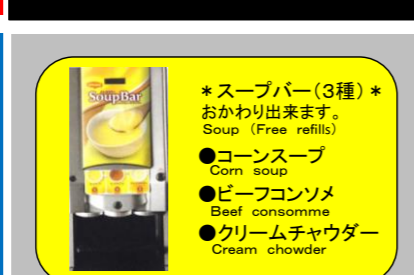
21 Soup bar (Free refills) スープバー *販売時間 14:00まで ¥400

* DRINK * 24 生ビール Draft Beer ¥700 25 グラスワイン 赤 Glass wine Red ¥600 26 グラスワイン 白 Glass wine White ¥600 27 ハイボール (サントリー角ハイボール) High ball ¥500 28 サントリーオールフリー Beer taste drink ¥400