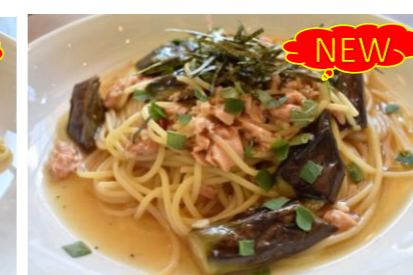
12 Spaghetti tuna and eggplant Japanese-style ツナと茄子の和風スパゲッティ 日替わりメニュー *サラダ・スープバー付き ¥1,500