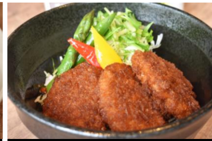
2 Sauce filet outlet rice bowl ソースひれかつ丼 *サラダ・スープバー付き ¥1,800