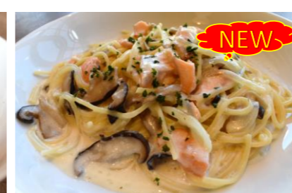
11 Spaghetti salmon and mushroom cream 鮭ときのこのクリームスパゲッティ 日替わりメニュー *サラダ・スープバー付き ¥1,700