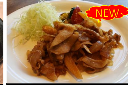
14 Pork ginger plate ポークジンジャープレート *ライス・サラダ・スープバー付き ¥2,000