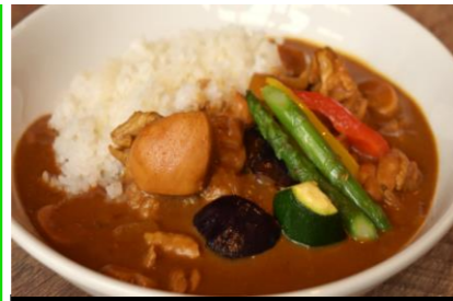
1 Butter chicken curry バターチキンカレー *サラダ・スープバー付き ¥1,400