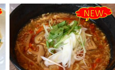
13 Hot sour soup noodles 新潟県産かぐら南蛮入り酸辣湯麺 *サラダ・スープバー付き ¥1,500