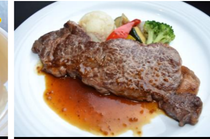
8 Beef loin steak plate ステーキプレート *ライス・サラダ・スープバー付き ¥2,300