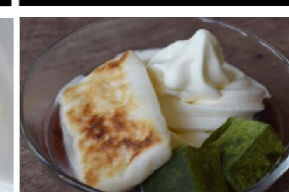
20 Chilled OSHIRUKO with ice cream 冷やしおしるこアイス添え ¥600