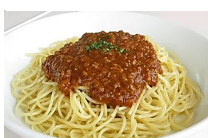
4 Spaghetti meat sauce ミートソーススパゲッティ *サラダ・スープバー付き ¥1,400