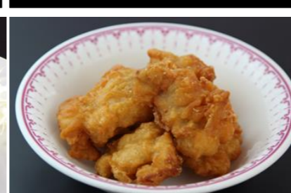
18 Fried chicken フライドチキン ¥600