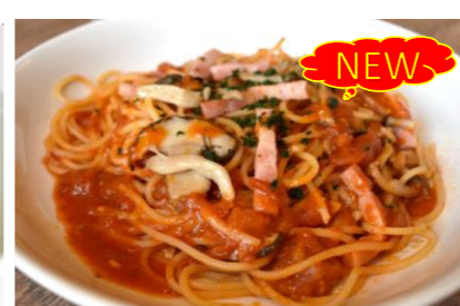
10 Spaghetti mushroom bacon tomato sauce きのこベーコンのトマトソーススパゲッティ 日替わりメニュー *サラダ・スープバー付き ¥1,600