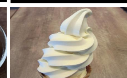
22 Soft ice cream ソフトクリーム ¥600