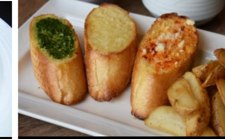
15 Garlic toast ガーリックトースト *サラダ・スープバー付き ¥1,200