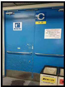
青い扉：男性更衣室