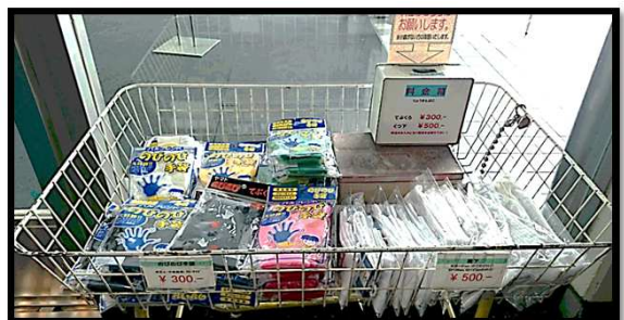
手袋：ご自身でご用意ください、¥300で販売もございます