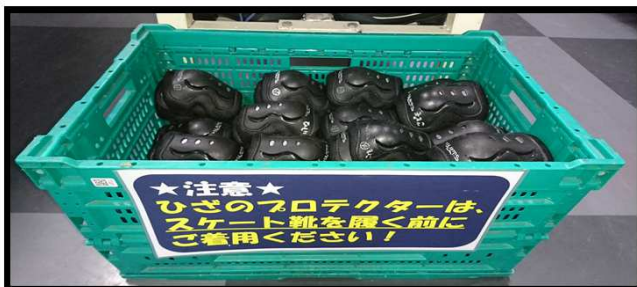
プロテクター(貸出用)：スケート靴を履く前に装着してください