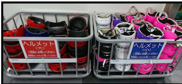
ヘルメット：ご自身でお持ちの方はご持参ください(数に限りがございます)