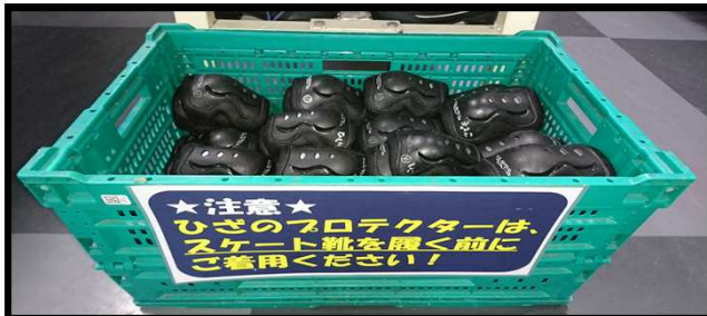
プロテクター(貸出用)：スケート靴を履く前に装着してください