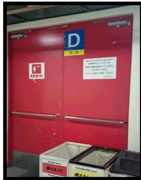
赤い扉：女性更衣室