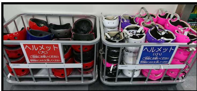
ヘルメット：ご自身でお持ちの方はご持参ください(数に限りがございます)