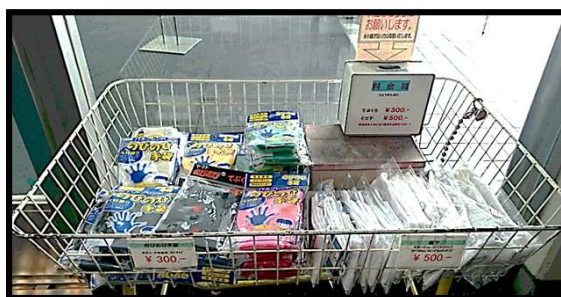
手袋：ご自身でご用意ください、¥300で販売もございます