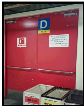
赤い扉：女性更衣室