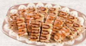
ミックスサンドオードブル

A(ハーフカット18パック) 4,200円(税込4,620円) B(ハーフカット22パック) 5,100円(税込5,610円) C(ハーフカット26パック) 5,950円(税込6,545円)