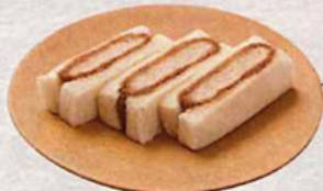
メンチかつサンド