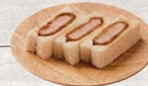
ハニーマスタードヒレかつサンド