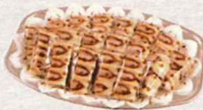
ヒレかつサンドオードブル

A(ハーフカット18パック) 4,200円(税込4,620円) B(ハーフカット22パック) 5,100円(税込5,610円) C(ハーフカット26パック) 5,950円(税込6,545円)