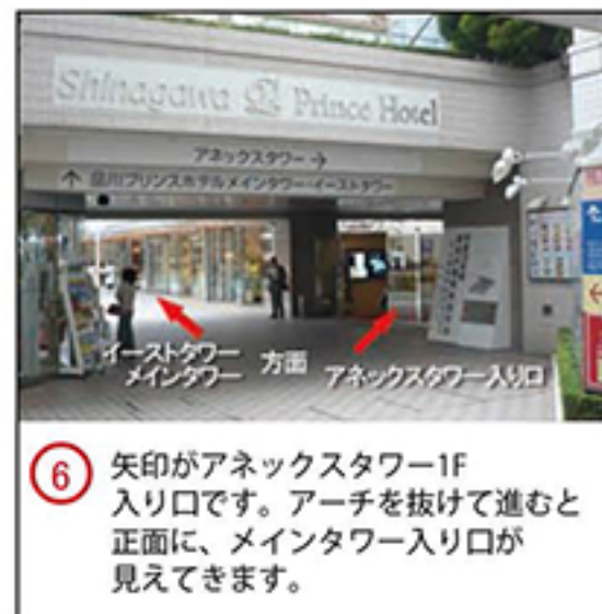
⑥ 矢印がアネックスタワー1F入り口です。アーチを抜けて進むと正面に、メインタワー入り口が見えてきます。