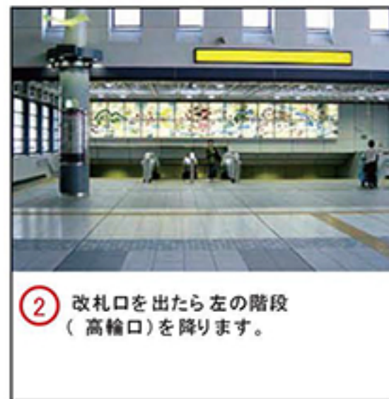
② 改札口を出たら左の階段（高輪口）を降ります。