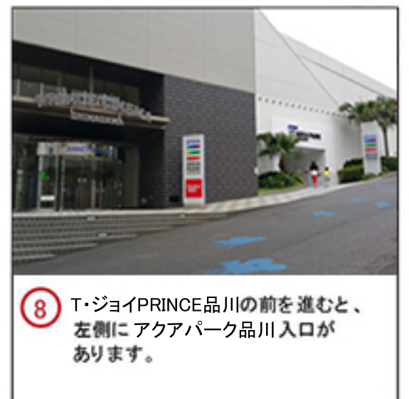
⑧ T・ジョイPRINCE品川の前を進むと、左側にアクアパーク品川入り口があります。