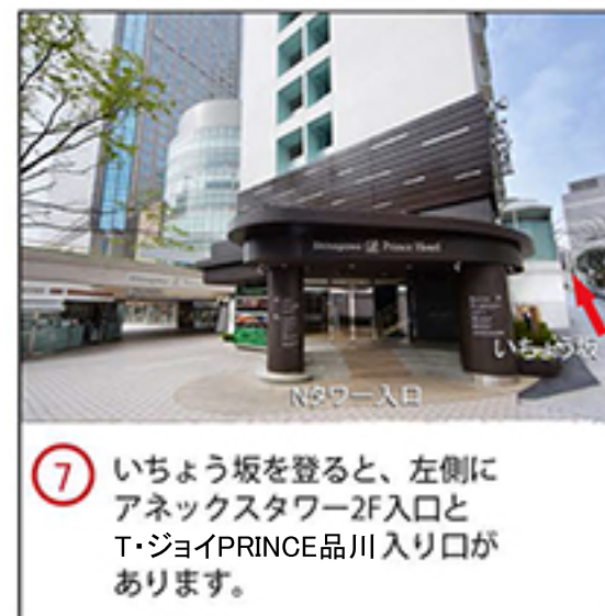
⑦ いちょう坂を登ると、左側にアネックスタワー2F入口とT・ジョイPRINCE品川入り口があります。