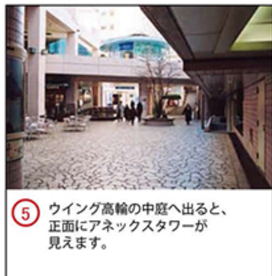
⑤ ウイング高輪の中庭へ出ると、正面にアネックスタワーが見えます。