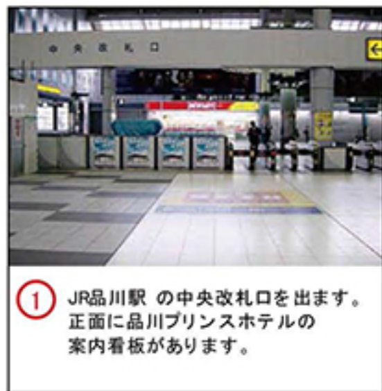
① JR品川駅の中央改札口を出ます。正面に品川プリンスホテルの案内看板があります。

※品川プリンスホテルは、品川駅から徒歩2分とアクセスが大変便利です。 ※駐車場には限りがございますので、電車・バスをご利用ください。 ※時間によりウイング高輪は通行できない場合がございますのでご了承ください。