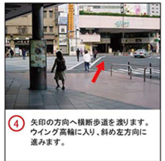
④ 矢印の方向へ横断歩道を渡ります。ウイング高輪に入り、斜め左方向に進みます。