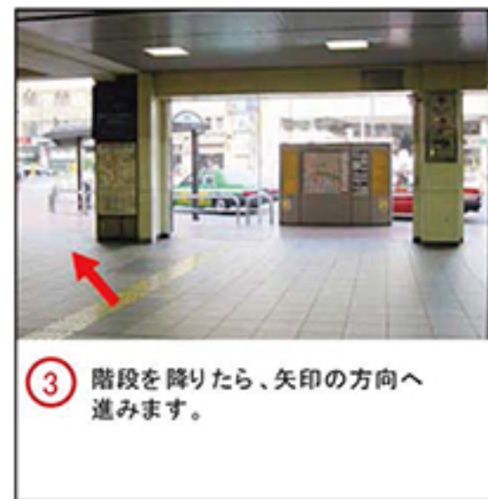
③ 階段を降りたら、矢印の方向へ進みます。