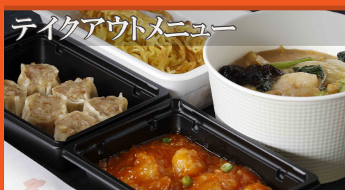
テイクアウトメニュー

芙蓉菜譜コース (全 8 品) 1名さま ￥5,750 ※別途サービス料 (10%) 頂戴いたします。