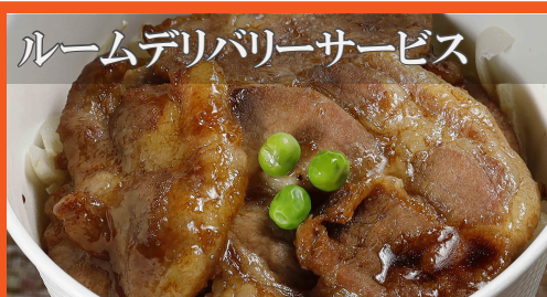
ルームデリバリーサービス

※別途サービス料 (10%)、テーブルチャージ (1 名さま ￥600) を頂戴いたします。