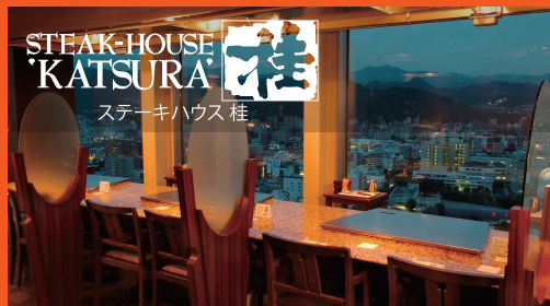
STEAK-HOUSE KATSURA ステーキハウス 桂