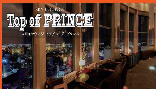
SKY LOUNGE Top of PRINCE スカイラウンジ トップ オブ プリンス