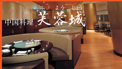
中国料理 芙蓉城 ふようじょう