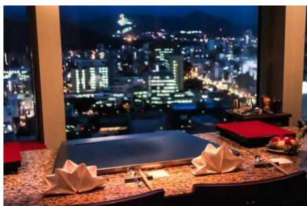
ステーキハウス 桂

「スカイラウンジ トップ オブ プリンス」では、高さ約 6m の開放感に溢れる窓から JR 札幌駅方面から大倉山ジャンプ競技場までの札幌市北東～西側の景色をお楽しみいただけます。世界三大珍味を使用したコース料理とスパークリングワインを含む 30 種類以上の飲み放題付きプランは、クリスマスデートにもグループでのパーティーにもおすすめです。