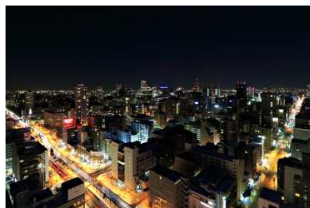
フランス料理 トリアノン

◎本件に関する報道各位からのお問合せ 札幌プリンスホテル 営業企画 TEL:011-241-1114 FAX:011-271-6647 http://www.princehotels.co.jp/sapporo/