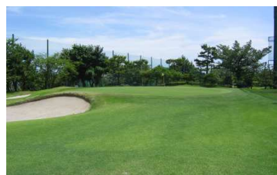
9 ホール・アイアンコース

尚、媒体掲載にあたっては、読者特典(貸ボール割引チケットなど)も可能ですので、是非ともゴルフ場担当者にご相談ください。