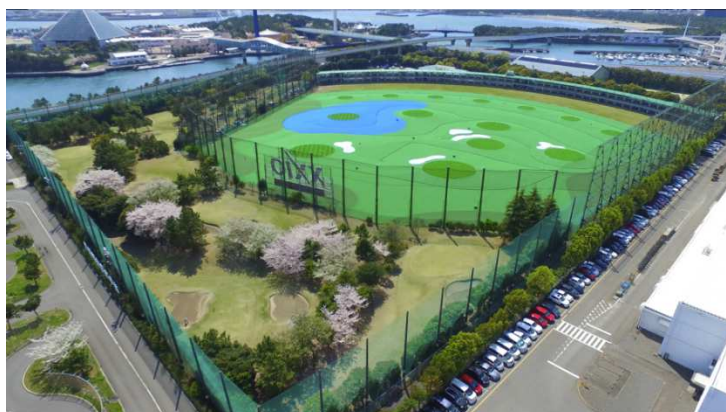
200 打席・280 ヤードの爽快感と気軽に楽しめるアイアンコース

※料金は全て消費税が含まれております。※詳しくは杉田ゴルフ場までお問合せください。