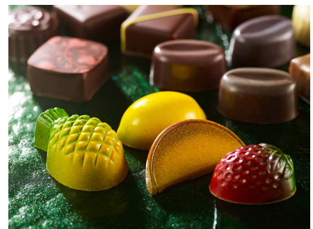
オリジナルチョコレート (イメージ)