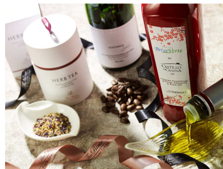
ギフト商品 (イメージ)