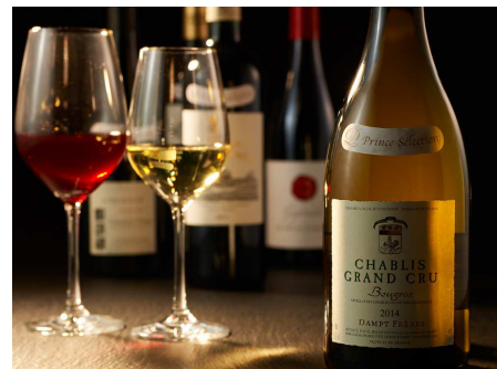
セレクトワイン (イメージ)

※上記料金には、消費税が含まれております。 ※仕入状況により、食材・メニューに変更がある場合がございます。 ※写真はイメージです。