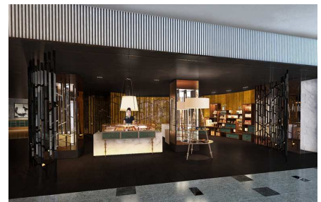
THE SHOP at the Park (イメージ)