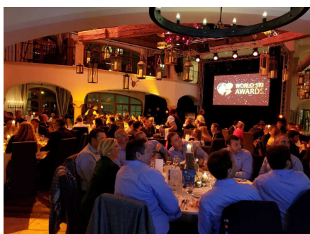
11月18日に開催された授賞式の様子

プリンスホテルは、さまざまな国際大会の会場としてご利用いただける施設やお子さまにも安全に楽しんでいただけるファミリー向けの施設など、ご利用者のさまざまなニーズに対応できる国内外10のスキーリゾートを有しています。今回、ベスト3に選出されたことをステップに、今後も多くのお客さまに楽しんでいただけるスキーリゾートを目指し、さらなるサービス向上に努め、スキー観光産業の発展に寄与してまいります。