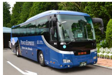
プリンスエクスプレス箱根芦ノ湖