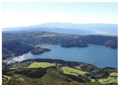
駒ヶ岳山頂からの眺望