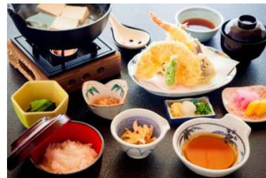
箱根姫の水たま肌木綿湯豆腐御膳

お問合せ先:箱根関所 旅物語館 TEL:0460-83-6355(受付時間:8:40A.M.~5:00P.M.)