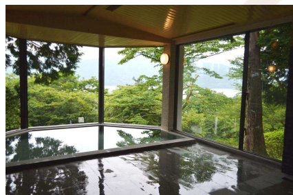
自然に囲まれた男性用露天風呂