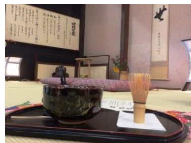
お抹茶体験イメージ