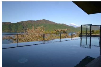
女性用露天風呂からの芦ノ湖と富士山