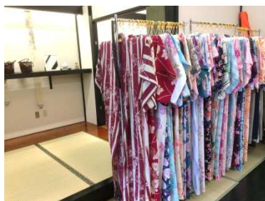
着付け体験イメージ