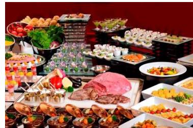
レイクサイドグリル buffetランチ