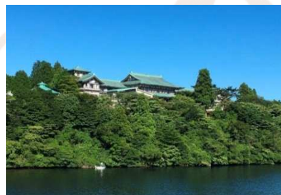
芦ノ湖からの龍宮殿本館

◎本件に関する報道各位からのお問合せは 株式会社プリンスホテル 箱根事業戦略 / 広報担当 TEL:0460-83-1130(直通) FAX:0460-83-1213