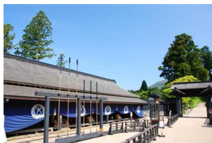
箱根関所跡イメージ