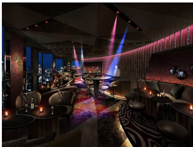
DJ ブースを備える「Nine Bar」 イメージ

◎本件に関する報道各位からのお問合せは 株式会社プリンスホテル 高輪・品川マーケティング戦略 TEL: 03-3447-1133(直通) FAX: 03-3473-1115