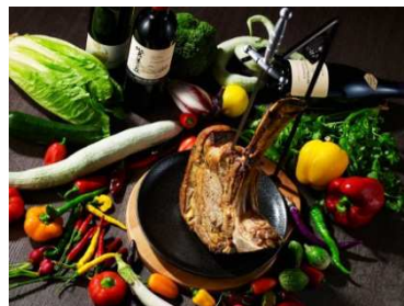
Grill&Steak の料理 イメージ