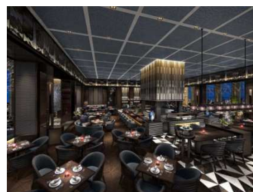
Tokyo Fusion Dining イメージ