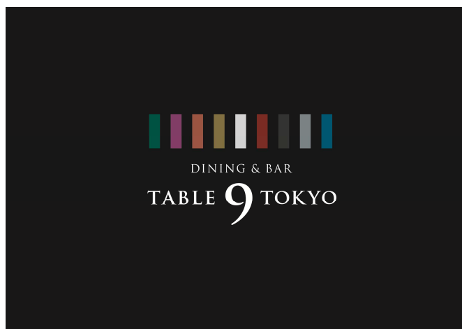
Dining&amp;Bar TABLE 9 TOKYO ロゴ

当ホテルは、宿泊・料飲機能に加え、アクアパーク品川、映画館、ライブホールなどのエンターテインメント施設を備え、「ホテルの枠を超えたエンターテインメントタウン」を目指し、バリューアップを進めております。今回、東京の象徴となる、おとなが遊べる“ナイトエンターテインメント”スポットをオープンさせることで、発展する品川の街に新たな人の流れを創出してまいります。