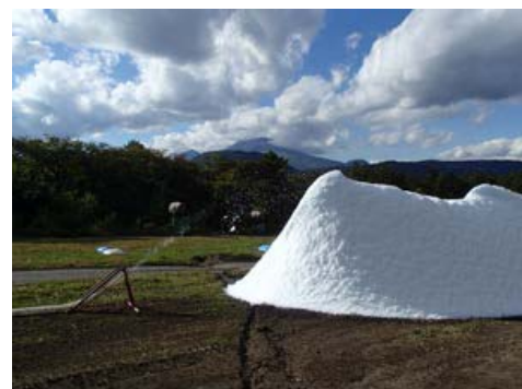
スキー場での造雪の様子

◎本件に関する報道各位からのお問合せ先 軽井沢プリンスホテルスキー場 TEL:0267-42-5588 FAX:0267-42-8771 軽井沢プリンスホテル マーケティング戦略 TEL:0267-42-8115 FAX:0267-42-8118 http://www.princehotels.co.jp/ski/karuizawa/