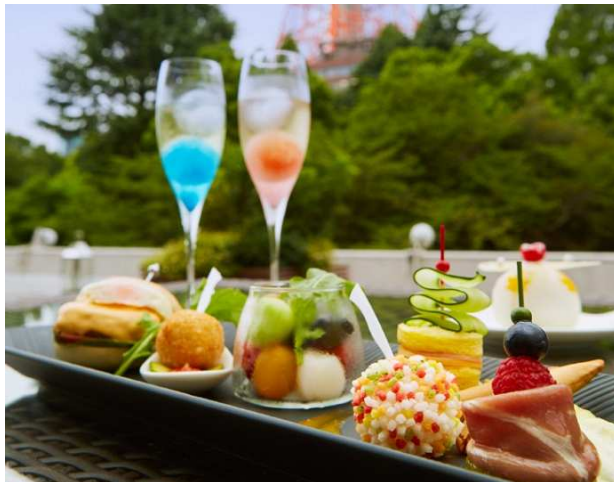
一口サイズのまるい形のメニューやドリンクでそろえた 女子会メニュー「Moon Night Party」(イメージ)

©本件に関する報道各位からのお問合せは 東京プリンスホテル マーケティング戦略 広報担当 TEL: 03-5400-1180(直通) FAX: 03-5400-1174