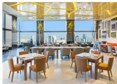
All-Day Dining OASIS GARDEN 内観

※上記メニューにつきましては、仕入れの状況により、食材・メニューに変更がある場合がございます。