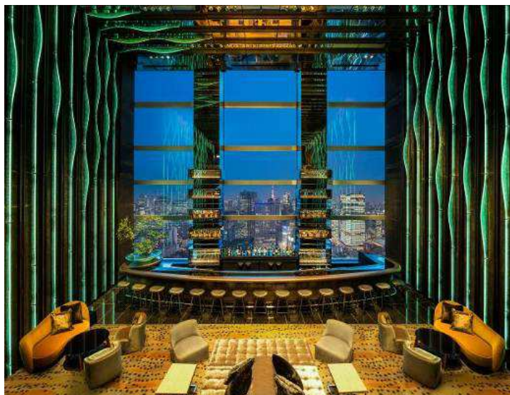
スカイギャラリーラウンジ レヴィータ 内観

そのほか、開業 1 周年を記念しニューヨーク近代美術館 (MoMA) のミュージアムショップ、MoMA Design Store とコラボレーションしたオリジナルの記念品付き宿泊プラン「Your Gallery」、テディベアのトップブランドであるシュタイフ社とのコラボレーションで実現した限定オリジナルベア「1st アニバーサリーベア」もご用意しております。