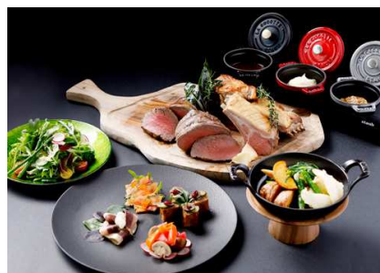
Premium Meat Selection (イメージ)