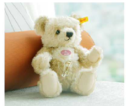
1st アニバーサリーベア

【内 容】シュタイフ社製テディベア(モヘア素材・ベージュ・28cm) スワロフスキー社製鍵モチーフのペンダント ※オリジナルチェストタグ付き ※消費税込み