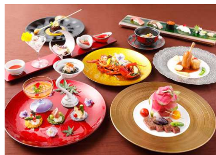
ギャラリーKAISEKI(イメージ)