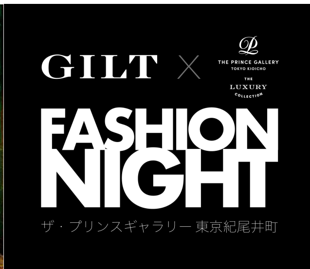
「ザ・プリンスギャラリー 東京紀尾井町×GILT FASHION NIGHT」

◎本件に関する報道各位からのお問合せは ザ・プリンスギャラリー 東京紀尾井町 事業戦略(マーケティング) TEL: 03-3234-1191(直通) FAX: 03-3234-1179