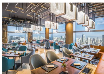
WASHOKU 蒼天 SOUTEN 内観