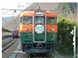
行先表示板やヘッドマーク展示など