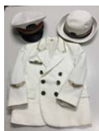
こども駅長制服記念撮影

【初日(8/5)限定イベント】ホクトのジャンボきのこの展示/ホクトのエリンギ、アルクマグリーティング