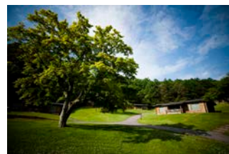
ウェストコテージイメージ

※料金には 1 名さまの 1 泊室料、夕食(buffetのみ)、朝食、消費税、サービス料が含まれております。