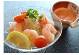
小海老カクテルサラダ