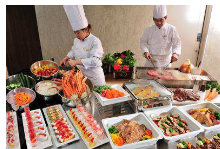
「レイクサイドグリル」ランチbuffetイメージ