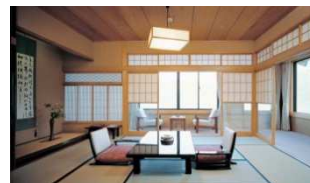
貸切個室イメージ