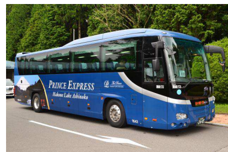
プリンスエクスプレス箱根芦ノ湖