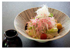
胡麻だれサラダそば・うどん