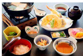
箱根姫の水たま肌木綿湯豆腐御膳