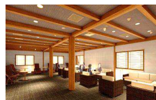
ご宿泊者専用ラウンジ