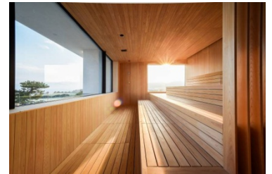
【パノラミックサウナ】

エクスペリエンスシャワー … さまざまな演出を楽しむことのできる身体を冷やすためのシャワー