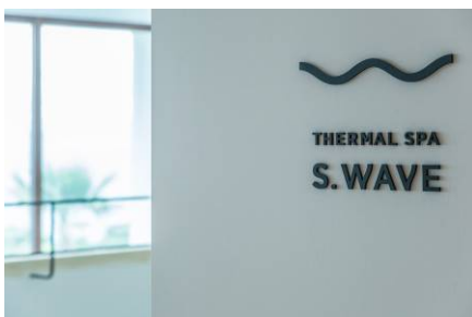
【スパフフロントのロゴデザイン】

「THERMAL SPA S.WAVE」の受付となります。タオルやガウンの貸出しのほか、トリートメントルームで 使用しているアメニティなどを販売いたします。