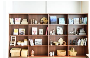
【インテリアディスプレイの一例】

「この寛容な建築物のなかで、モダンな建築物にモダンなオブジェクトで演出するのではなく、いい意味で“馴染む違和感”を意識しました。そこで多国籍で非日常的なオブジェなどでリラックス感やラグジュアリー感を取り入れ、アーバンリゾートに仕上げました。それぞれのエリアをひとつのカタマリ（モノが集合しているけれど、フラットな1枚壁）という考え方でスタイリングをしています。」