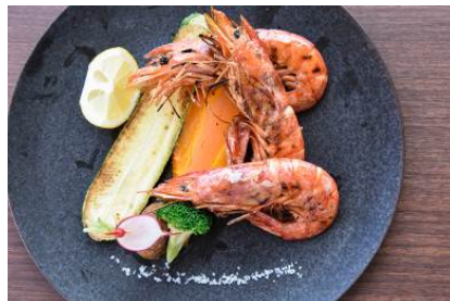
【赤海老のグリル温野菜添え】