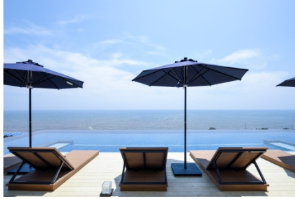
【インフィニティプール】