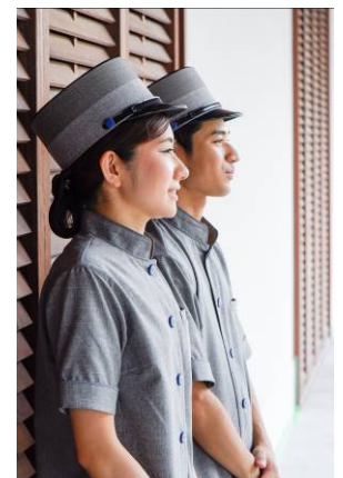
【スタッフユニフォームの一例】

「大磯プリンスホテルのイメージが海というところから始まりました。大磯 ⇨ 海 ⇨ 制服 ⇨ 海軍 (US NAVY) のユニフォーム デザインは、機能性にも優れた US NAVY のユニフォームからインスピレーションを得ています。また、大磯プリンスホテルが温泉・スパ施設を新設することや、もともと大磯が著名人の休養、保養の地であった歴史をふまえ、よりリラックスした空間をイメージしました。よって本来の制服の持つ格式高いイメージよりも、よりカジュアルな素材（麻風に見えるポリエステル素材）、シルエット（ワイドゴムパンツ、ドロップショルダー）をご提案させていただきました。」