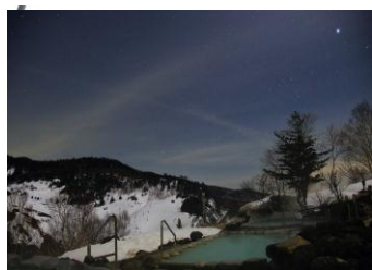
No. 93 #星空風呂で願い事をする (万座プリンスホテル)