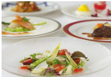
No. 97 #地元でとれた夏野菜を味わう (万座プリンスホテル)