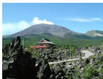
No. 34 #溶岩にさわってみる (嬭恋プリンスホテル・鬼押出し園)