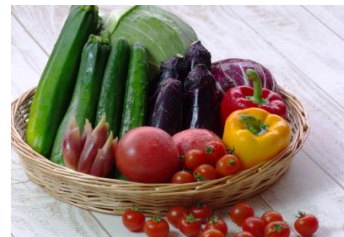
No. 98 #地元農家の野菜をお土産にする (万座高原ホテル)

©本件に関する報道各位からのお問合せ 株式会社プリンスホテル 万座・嬭恋地区 TEL:0279-97-3111 FAX:0279-97-3771