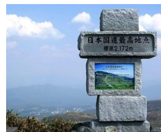
No. 77 #雲上ドライブで風を感じる (嬭恋プリンスホテル)