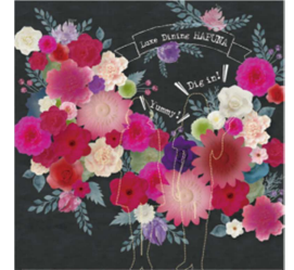
フォトスポット イメージ

ハワイの州花でもあるハイビスカスや、有名なプルメリアなど色とりどりの花々を飾ったリゾート感溢れるフォトスポットをエントランス付近のスイーツコーナー前に新設します。