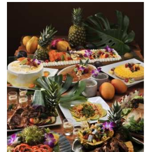
ハワイアンフェア ディナーメニュー イメージ