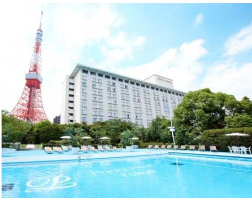
東京タワーを背景に緑に囲まれた「GARDEN POOL」

昼はタワービューのプール、夕暮れからは今年 4 月に新たにオープンした屋外テラス席の「カフェ&バー タワービューテラス」(3F)でライトアップした東京タワーを見上げながらバータイム、さらに東京タワー側のお部屋でのご宿泊をお楽しみいただけます。時間帯やスポットにより異なる表情のタワービューとともに、都心で過ごす夏のリゾートプランとして、「SNS 映え」への意識が高い女性グループやカップルに向けて訴求してまいります。