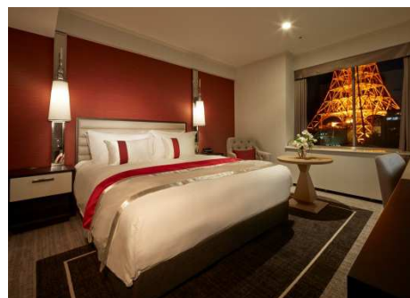
東京タワーを窓外に臨む タワービュー確約のお部屋で ゆったりと滞在