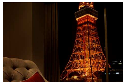
(上) 東京タワーを見上げる屋外テラスの「カフェ&バー タワービューテラス」 (下) 客室から望む東京タワー