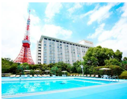
日中は緑に囲まれた 開放的なプールで

今年新たにオープンしたレストランと、装い新たに生まれ変わった客室、都心のリゾートのような「GARDEN POOL」とともに、東京タワーの眺めをご堪能いただく「タワービュー尽くし」のご宿泊プランをご用意しました。撮影映えするロケーションを活かした、SNS が好きな女性同士やカップルにおすすめのプランです。