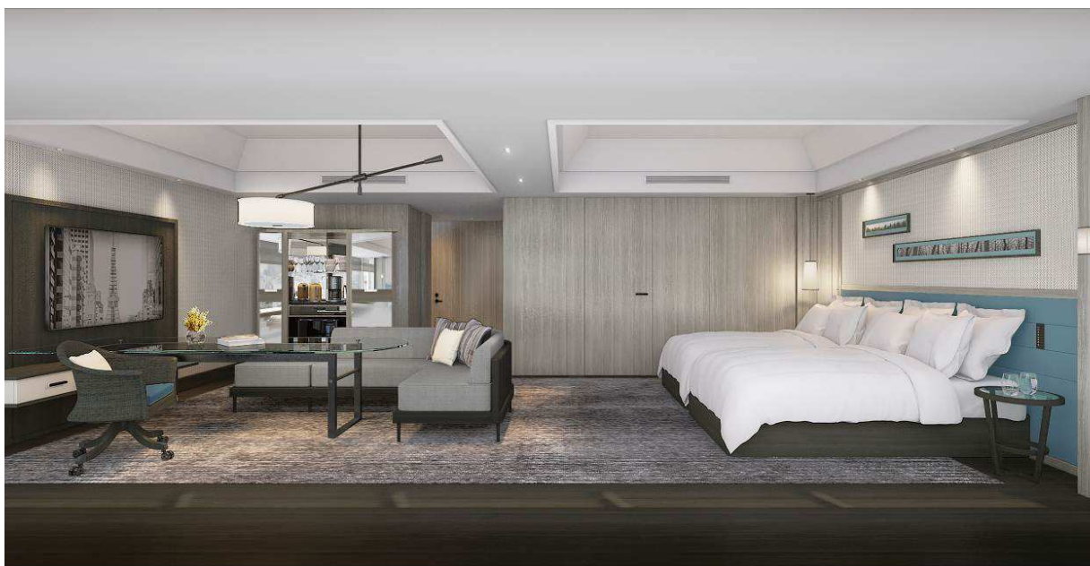
パノラミックジュニアスイートルーム (イメージ)

ザ・プリンス パークタワー東京は、東京タワーなど東京を代表する観光スポットに隣接する都心にありながら周囲を芝公園の緑に包まれる貴重なロケーションに立地しております。周辺エリアではビジネス再開発が進み、国内外から多くのお客さまが集まるエリアとなることが見込まれていることから、幅広い層のお客さまの多様なニーズに対応するため、同じ芝公園エリアの東京プリンスホテルとともに、エリア全体で受け皿としての機能強化のための改装を 2016 年より順次実施しております。