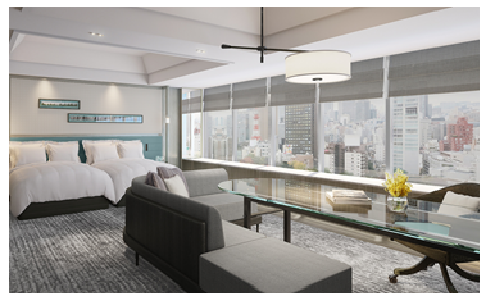
パノラミックジュニアスイートルーム(イメージ)