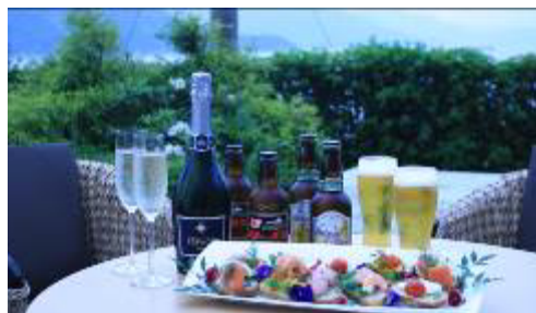
オードブルセットイメージ

※画像はイメージです。 ※料金には、サービス料・消費税が含まれております。 ※仕入れの状況により、食材・メニューに変更がある場合がございます。