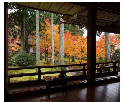
三千院門跡 有清園