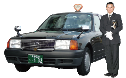
MK の観光タクシードライバーがご案内