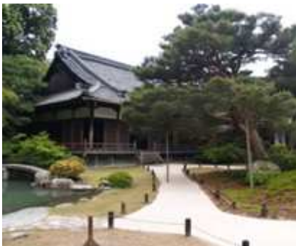
青蓮院門跡 小御所

観光ガイドタクシーは、MK タクシーの京都に精通したドライバーをご用意いたしました。京都に何度もお越しいただいているお客さまにも、新たな発見をしていただけるご案内をさせていただきます。