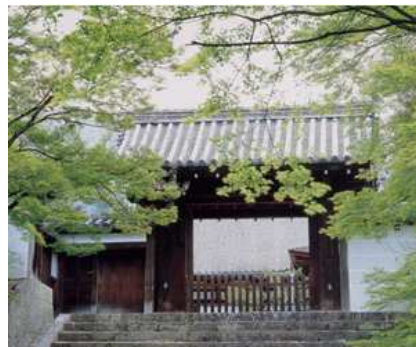
曼殊院門跡 勅使門