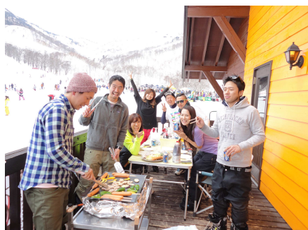
仲間で楽しく BBQ(和田小屋 2F テラス)