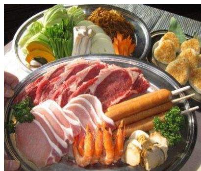
バーベキューメニューイメージ