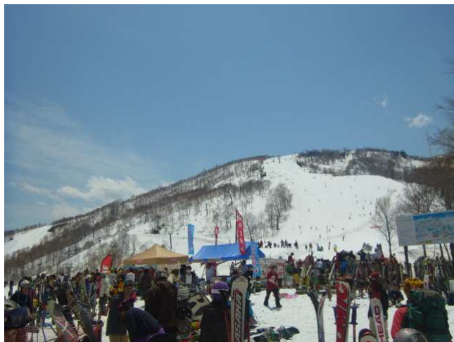
ゴールデンウィーク期間中のかぐらステージ付近の賑わい

また、営業期間も県内唯一の長さを誇り、今シーズンは5月28日（日）までスキー・スノーボードを楽しむことができます。