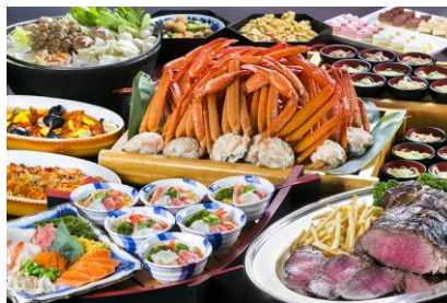
プリンスルーム buffetイメージ