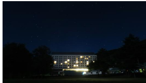
雫石ゴルフ場よりホテル方向の星空