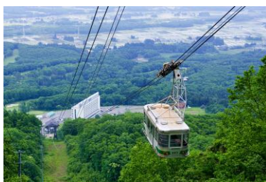
雫石ロープウェー(日中の写真)