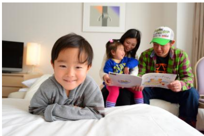
ファミリーイメージ

※料金には 1 泊室料、夕朝食buffet、雫石ロープウェー乗車、小岩井農場まきば園入場券、サービス料、消費税が含まれております。入湯税(おとなのみ¥150)は含まれておりません。