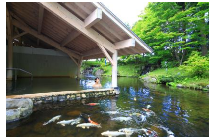
雫石高倉温泉イメージ

◎お客さまからのお問合せ・ご予約は雫石プリンスホテル TEL:019-693-1114 にて承ります。