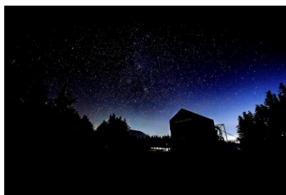
雫石ロープウェー山頂駅の星空

雫石プリンスホテルの標高は約 450m、そこから約 10 分の雫石ロープウェーの空中散歩は雫石の夜空を手軽に楽しむのに最適です。標高差 280m で山頂駅付近は約 730m。東京タワーの 2 倍よりも高い場所に降り立ちます。山の澄んだ空気と街の灯りの少なさが星の観察する気分をさらに盛り立てます。