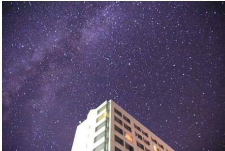
雫石プリンスホテル上空の星空