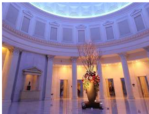
謎解きに満ちたホテル内