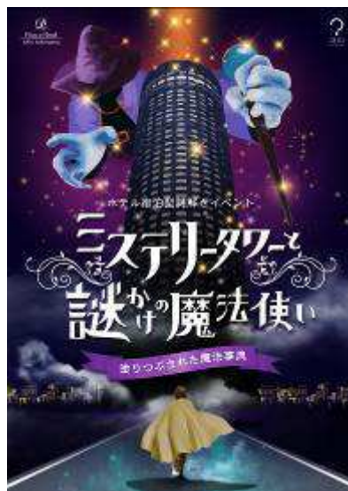
ストーリーイメージ

◎本件に関する報道各位からのお問合せは 新横浜プリンスホテル 事業戦略／広報担当 TEL:045-471-1113 FAX:045-471-1189 http://www.princehotels.co.jp/shinyokohama/