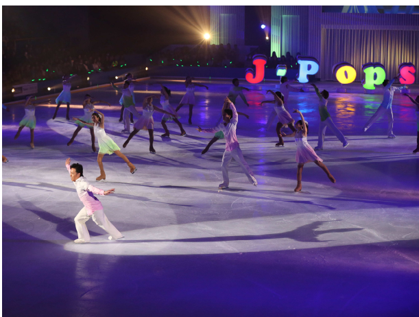
プリンスアイスワールド 2016 横浜公演の様子

尚、2017 年 1 月 28 日(土) 10:00A.M.より、チケット一般販売を開始いたします。