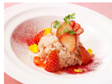
甘酸っぱいいちごのリゾット イメージ