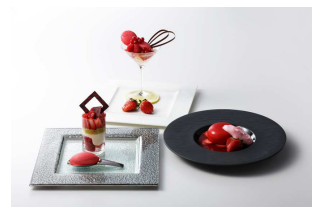
3種より選べるデザート イメージ