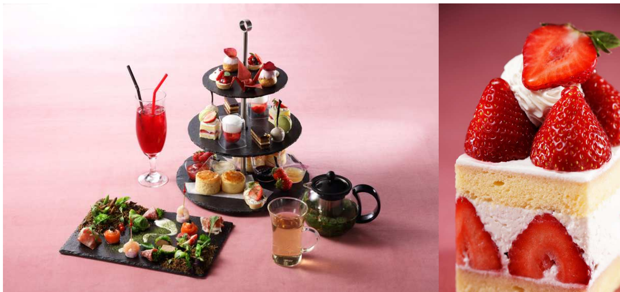
ストロベリーフェア イメージ

その他レストランでは、あまおうをふんだんに使ったパンケーキや、バラエティー豊かなスイーツ、女性におすすめのカクテルなど、期間限定でさまざまなメニューをご提供いたします。