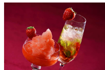
フローズン ストロベリーダイキリ(左)、 ストロベリーシャンパンモヒート(右) イメージ