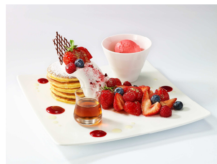
①あまおうパンケーキ イメージ