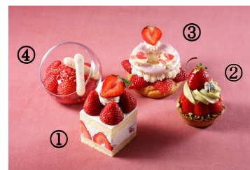
いちごスイーツ イメージ

①のみグランドプリンスホテル新高輪 1F「Lounge Momiji」でも販売。