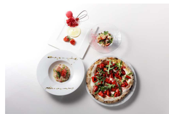
「Choice×2! Strawberry ランチ」イメージ