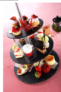
スイーツツリー イメージ