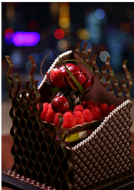
「Noel de Gallery écrin」

地上 140m の天空に舞い降りた宝石箱(フランス語で「écrin」)。宝石箱の外箱を彩るチョコレート細工は、ホテル内のバーのデザインをモチーフに、パティシエが技の粋を尽くしたもの。外箱をひらくと、中からは美しいジュエリーのようなケーキが姿をあらわします。素材は、スイス・フェルクリン社の最高級クーベルチュールチョコレートと上質なラズベリーをふんだんに使用。上質カカオの風味が生きるビターテイストに、とろけるような大人の甘さが口の中でとけあいます。さまざまなジュエリーが放つ煌めきのように、“初めての”煌く体験をお届けいたします。