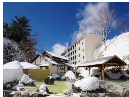
4種の源泉「石庭露天風呂」