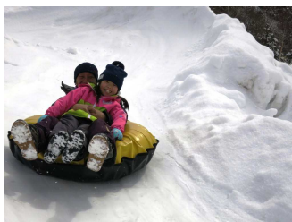
スノーチュービング

※上記料金にて、Manza スノーフィールド内の全てのアイテムをご利用いただけます。