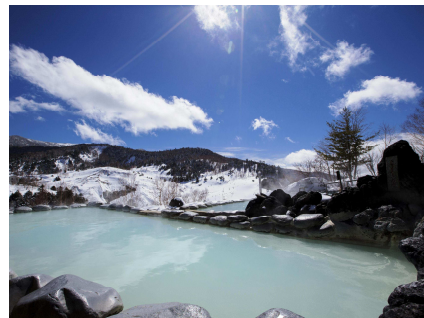
絶景露天風呂「こまくさの湯」