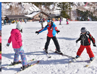
初級者練習ゾーン