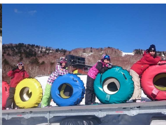
スノーエスカレーター