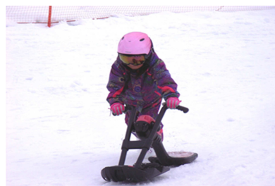
ブレーキが付いた新しい乗り物です。