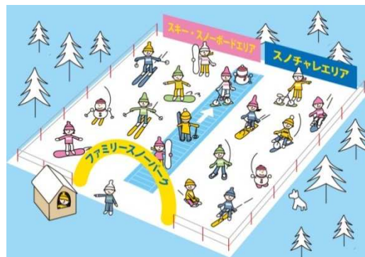
ファミリースノーパーク