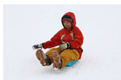
新感覚のソリ。体を傾けてターン。

【時 間】 8:30A.M.～4:00P.M. 【期 間】 2016 年 12 月 3 日(土)～2017 年 4 月 2 日(日) 【料 金】 おとな・こども同額