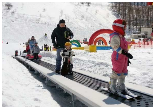
スノーエスカレーター

スキー・スノーボード初心者および、ファミリー・海外のお客さまに気軽に楽しんでいただける「ファミリースノーパーク」を新設いたします。全長約 70m のスノーエスカレーターを中央に設置し平均斜度 3° の緩やかな斜面上に、2 つのエリアを備え、初心者専用の「スキー・スノーボードエリア」と 6 つのウインターギアが楽しめる「スノチャレエリア」を作り、安心・安全に楽しめる新感覚のスノーパークです。