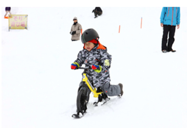
自転車とスキーが合体、バランスが大事。