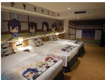
薄桜鬼～御伽草子～ ベッドルーム

コンセプトルームとは …「池袋らしさを楽しむ」ための一要素として、アニメをはじめそれぞれの作品の持つ世界観を表現できる特別なお部屋として、本年3月19日にオープン。これまでに「 はくおうき 薄桜鬼～ おとぎそうし 御伽草子～」や「 はくおうき 薄桜鬼 しんかい 真改」とのタイアップ宿泊プランを販売、両コンテンツとも当初の販売期間から延長するなど大変好評をいただいております。