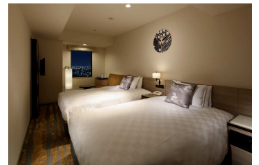
パノラマ ツインルームB (20.7㎡)