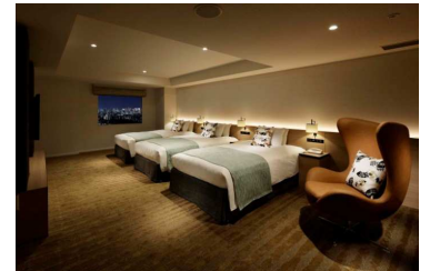
コンセプトルーム ベッドルーム(通常時)