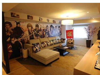
薄桜鬼 真改 リビングルーム