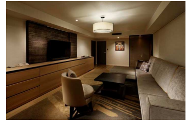
コンセプトルーム リビングルーム(通常時)