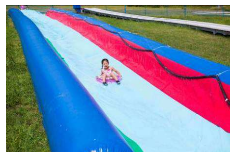
なえバッシューン!!