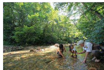
水辺の生物を観察