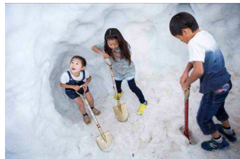
ゴンドラ山頂にて天然雪の雪山体験