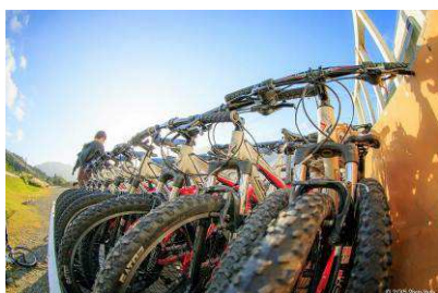
マウンテンバイク