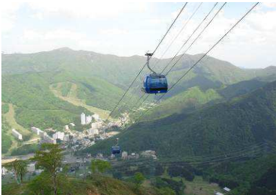
プリンス第2ゴンドラ