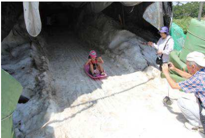
天然雪でのソリ遊び

また、雪山内の室温は2～3℃とたいへん涼しく、自然の冷蔵庫気分をお楽しみいただけます。