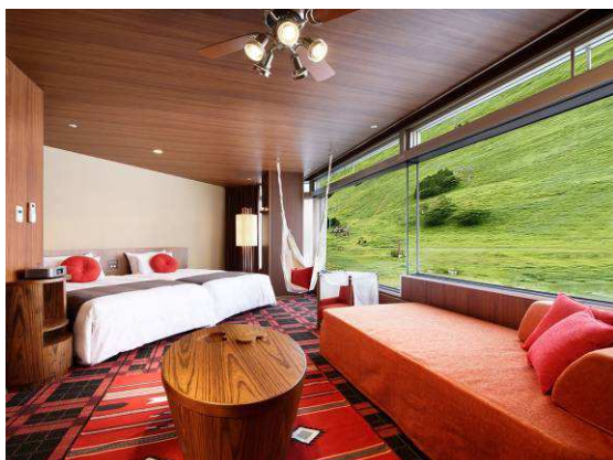
2号館暖らんROOM ハンモック

客室は、山小屋風のロッジをイメージしたファミリールーム。お部屋には大人気のハンモックをはじめ、パズル仕掛けのティーテーブルやめずらしいお子さま用の天蓋（天蓋）付アームチェアなど、お子さまが楽しめる要素が充実していて、部屋での楽しみがさらに広がります。