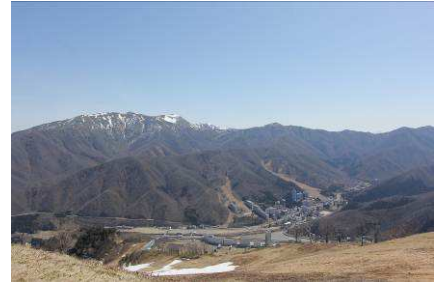
平標山など雄大な山々