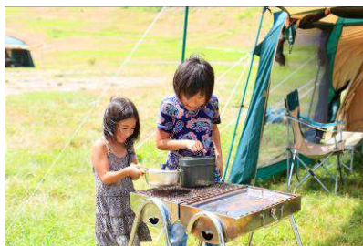
ホテルに泊まって手ぶらでお手軽デイキャンプ体験