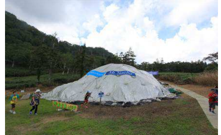
高さ約6mの天然雪の雪山