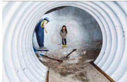
冷蔵庫気分が楽しめる雪山