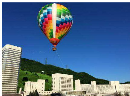
ホテル前で爽快な熱気球体験

そのほか、お子さま向け夏の室内スキー教室「 “夏”でもスキー体験 」をはじめ、「 熱気球体験 」や「 昆虫探し&川遊び 」など自然豊かな環境の中で 3 世代それぞれが苗場での過ごし方を選んでいただけるよう、ご家族のコミュニケーションを深めていただくアクティビティを多数ご用意いたします。