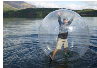
ウォーターボール