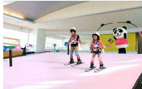
室内キッズゲレンデで、夏でもスキー体験

【お客さまからのお問合せ・ご予約先】 苗場プリンスホテル TEL:025-789-2211