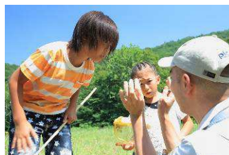
ツアーガイドと自然を探検