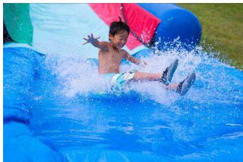
手作りウォータースライダーで涼水体験