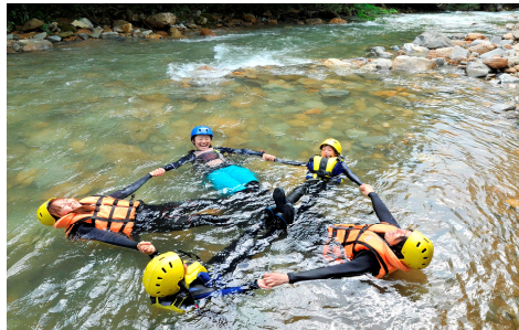
みんなでシャワーウォーキング体験