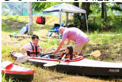
カヌーちょこっと体験