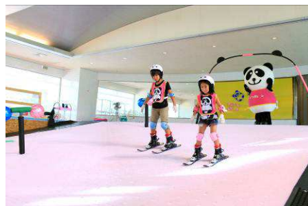
室内キッズゲレンデでスキー体験