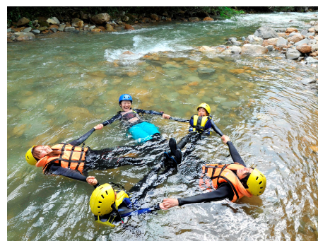
シャワーウォーキング