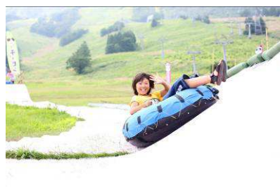
サマーチュービング