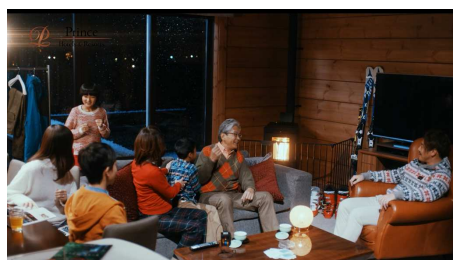
【家族向け(3世代団欒)】