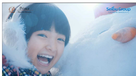
【家族向け(こどもと雪だるま)】