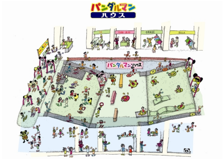
室内ゲレンデイメージ