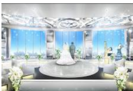
スカイチャペル（完成予想）