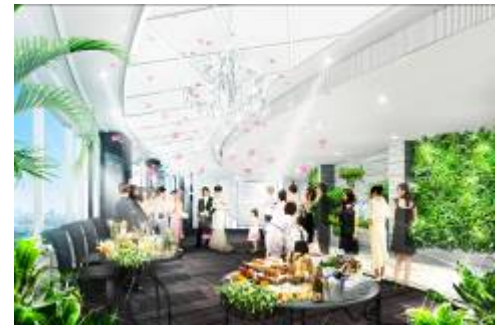
プレパーティールーム（完成予想）

挙式後にゲストと一緒に天空の空間で楽しいひと時が過ごせます。 天空での空間をさらにガーデニングにより、癒しの空間を演出します。 癒しを与えるガーデンスペースで、挙式の感動が分かち合えます。