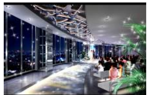
スカイチャペル ナイトバージョン（完成予想）

宝石のような夜景がドレス姿の花嫁をいっそう美しく映します。 新横浜地区ではそう簡単に実現できないナイトウェディングが 叶う瞬間です。