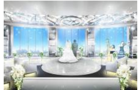
スカイチャペル（完成予想）

「スカイチャペル」がデイトタイムとナイトタイムで 2 つの顔を持つ ドラマティックな式場となってリニューアルオープンいたします。 祭壇の窓越しには開放感いっぱいの眺望が広がり、日中は陽光に 包まれ、夕暮れには煌めく光を、夜の帳が降りる頃にはたくさんの 星が感じられます。お招きしたゲストの皆さまを躍らせる華やかさと 優しさがあり、セレモニーは牧師、聖歌隊、ハーピストの編成で 厳かに執り行われ、新しい形の挙式が叶います。