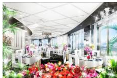
スカイバンケット (完成予想)

近隣施設が真似できない高層タワーの眺望を最大限に活かしたホテル最上階にあるパーティールームです。(定員：50 名まで) 豪華なシャンデリアとキラキラした陽光がふたりを祝福する美しい空間となっております。 昼と夜と別の顔を持ち、印象的な 1 日が叶います。