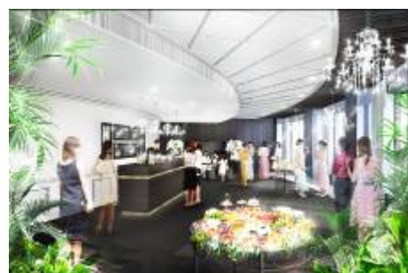
ホワイエ (完成予想)

バンケットルームのご利用でホワイエも贅沢に完全貸切ができます。 パーティー前のお出迎えからパーティー後のお見送りまで開放的なスペースで新郎新婦もゲストも自由に動き回って触れ合え、 プライベート感たっぷりの空間となります。