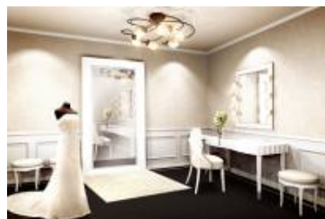
ブライズルーム (イメージ)

新郎新婦のブライズルーム(お仕度部屋)を新たに設けます。 今回、客室として利用している 6 階のシングルルーム 6 室を ゆったりとプライベート空間が楽しめる部屋にします。 お支度を整えたふたりは専用エレベーターで高層階に上がります。