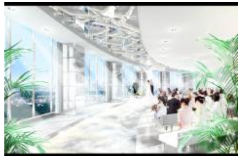
スカイチャペル デイトタイムバージョン（完成予想）