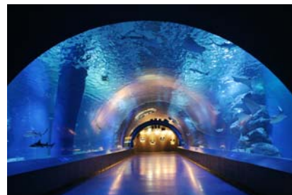
〈トロピカルフィッシュの海中トンネル〉

従来からの “夜も営業している水族館” という特徴に加え、 “連日午前中から楽しめる水族館” としても営業いたします。