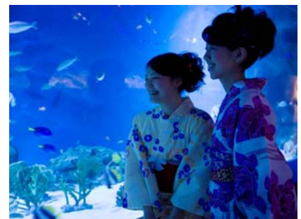
〈浴衣で水族館を楽しむ イメージ〉

この夏の品川プリンスホテルでは 浴衣がセットになった宿泊プランも登場 し、水族館以外の施設でもさまざまな浴衣特典をご用意いたします。