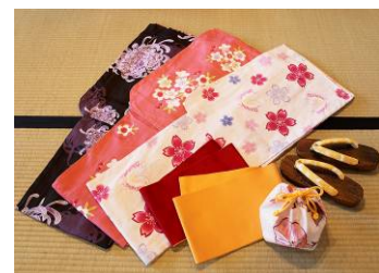
〈浴衣セット イメージ〉