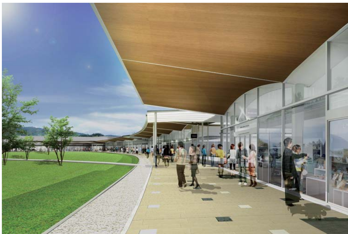
【軽井沢・プリンスショッピングプラザ ニューイースト増床エリア 完成予想パース】

店舗内部から外部の自然環境へ連続したシェルアーチ状の軒天井はふたつの空間を一体化します。ゴルフ場の面影を残す芝生のアンジュレーションと広い空を写す池を囲む6棟に分節された建物はゆるやかな勾配の屋根とともに爽やかに通り抜ける風と既存建物と軽井沢駅との間に連続性と回遊性のある空間を提供します。