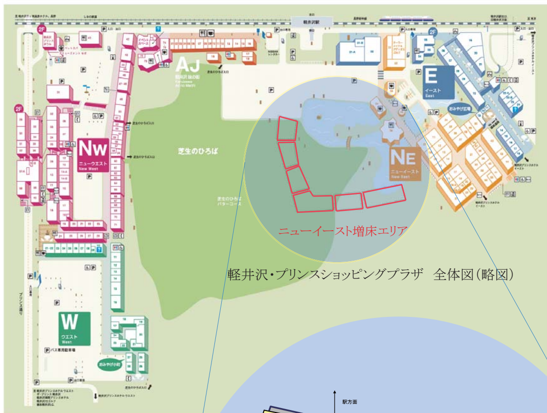
軽井沢・プリンスショッピングプラザ 全体図(略図)

それぞれのモールに多彩な店舗が並び、世界を代表する避暑地、軽井沢でセレクトなショッピングスタイル＝“ラグジュアリーリゾート”を提案いたします。