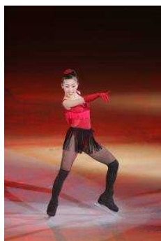
村主 章枝 (すぐり ふみえ)