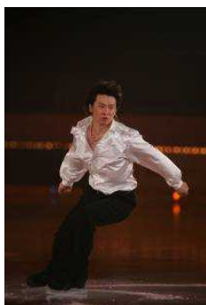
本田 武史 (ほんだ たけし)