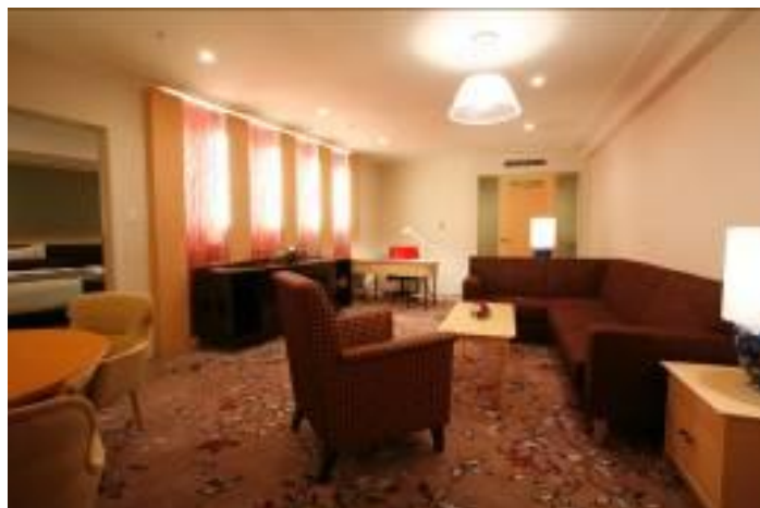
8階 スイートルーム