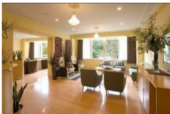
Wa'美 ヤマノビューティウエルネスサロン