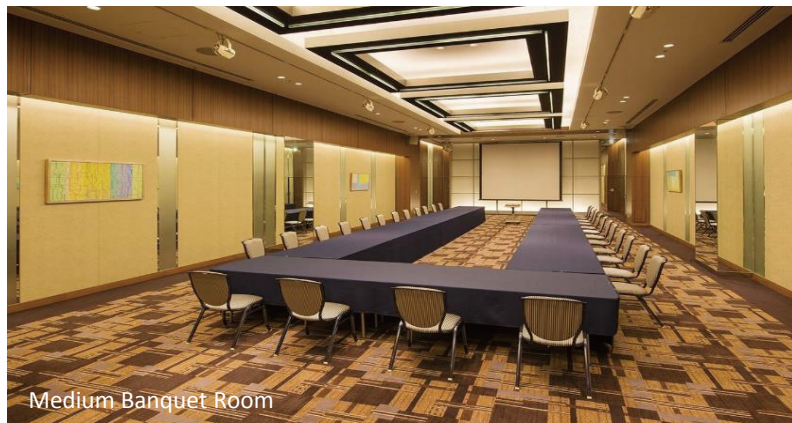
Medium Banquet Room