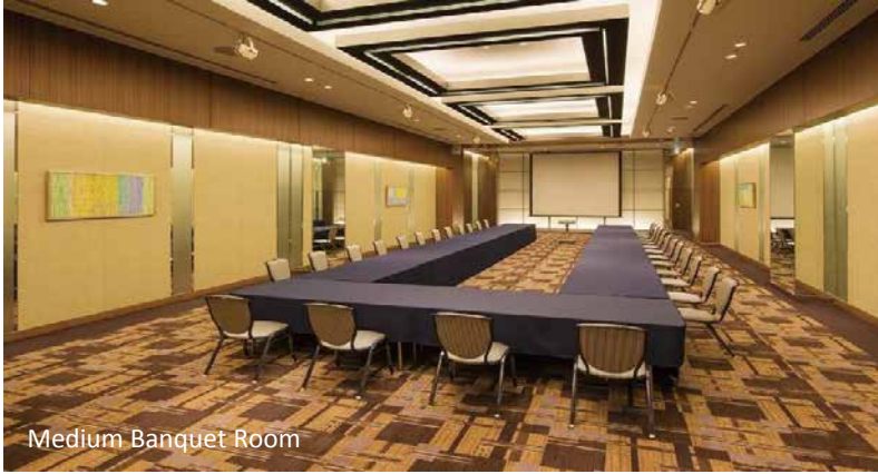
Medium Banquet Room