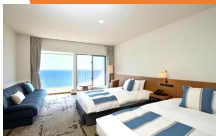
オーシャンビューツインルーム(28.6㎡)