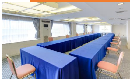
カンファレンスルーム(80㎡)