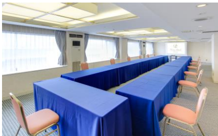
客室棟 3階・4階 カンファレンスルーム 縦5.2m×横15.4m 天井2.1m

新型コロナウイルス感染対策としてすべての宴会場はソーシャルディスタンスを保った形での対応をしております。宴会場のキャパシティはソーシャルディスタンスを考慮した値になります。