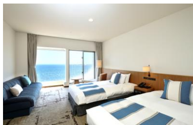
オーシャンビューツインルーム (28.6㎡)

※ミーティングプランは15名さまから60名さままでご利用いただけます。 ※ご利用の3ヶ月前からご予約いただけます。 ※料金には1名さまの1泊室料、お食事代(朝・夕各1回)、会場使用料、基本備品使用料、サービス料が含まれております。 ※別途消費税と入湯税150円頂戴いたします。 ※平日限定のプランになります。休前日は追加料金2,000円(税別)にてご利用いただけます。