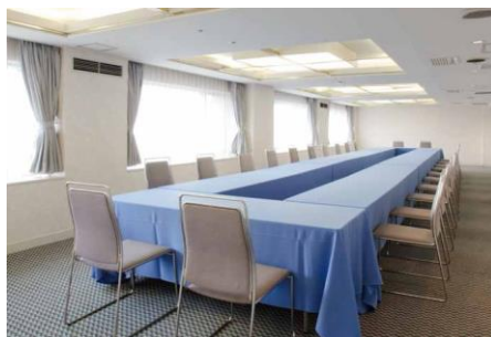
カンファレンスルーム(80㎡)