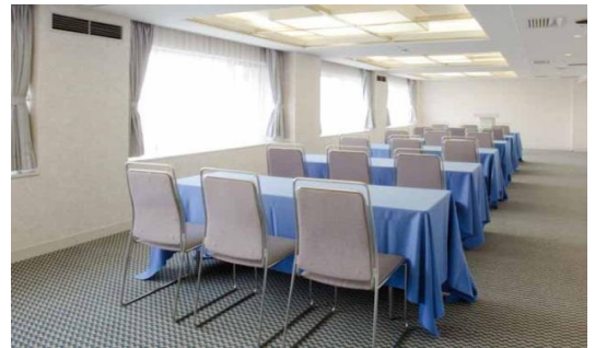
客室棟 3階・4階 カンファレンスルーム