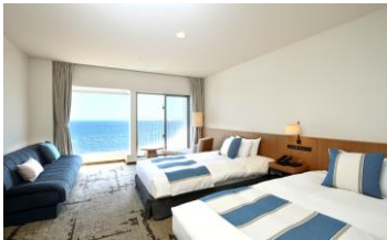
オーシャンビューツイン