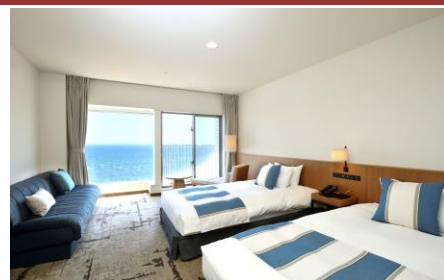
オーシャンビューツインルーム(28.6㎡)