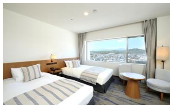
マウンテンビューツイン