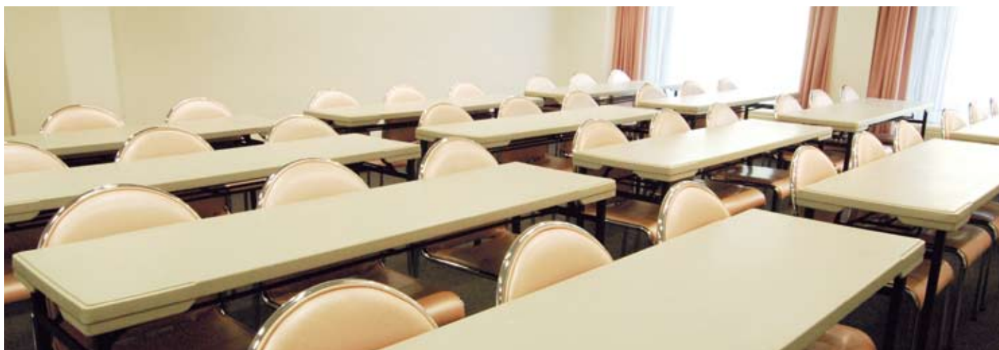
ゲレンデ側スクールスタイル