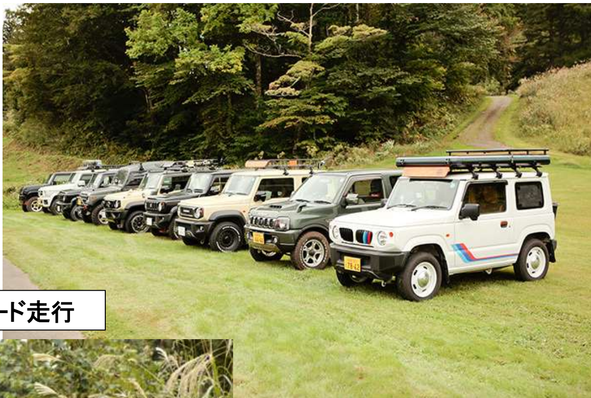
四駆のオフロード走行