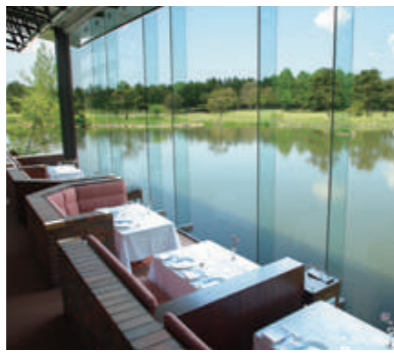
ダイニングルーム ボーセジュール