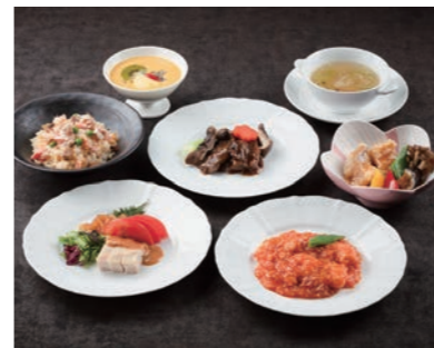
華 ~はなやか~ ¥6,000 (7品)