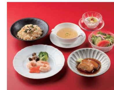
健 ~すこやか~ ¥3,500 (6品)