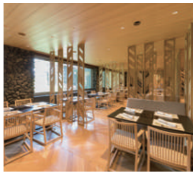
すき焼 しゃぶしゃぶ 鉄板焼 爽風