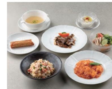
爽 ~さわやか~ ¥4,500 (7品)