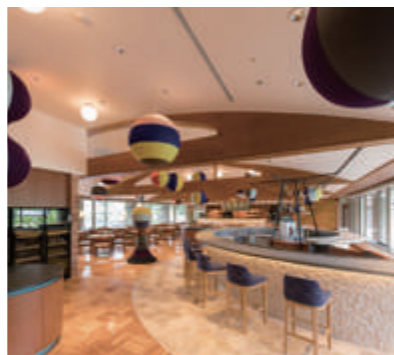
All Day Dining Karuizawa Grill