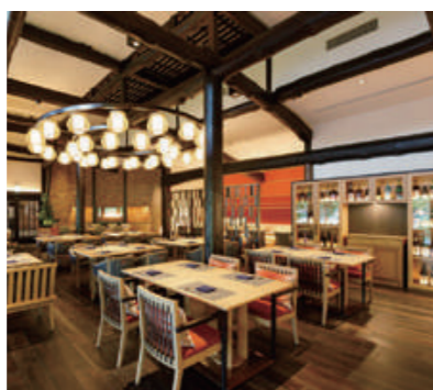
日本料理 からまつ