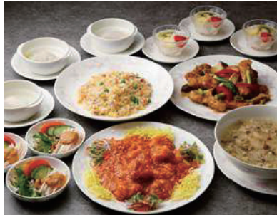
爽 〜さわやか〜 ¥3,800 (7品)

海老とトマトのパリパリサラダ フカヒレと冬瓜の淡雪とろみスープ 鶏肉の衣揚げと彩り野菜の黒豆ソース 炒め / 海老のチリソース 揚げワントン 飾り / 白身魚と玉葱の香り炒め 紅ズワイ蟹入り五目チャーハン フルーツとタピオカ入りマンゴー デザート