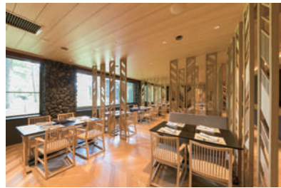
すき焼 しゃぶしゃぶ 鉄板焼 爽風