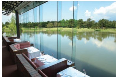
ダイニングルーム ボーセジュール