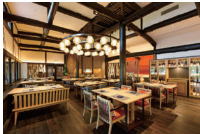
日本料理 からまつ