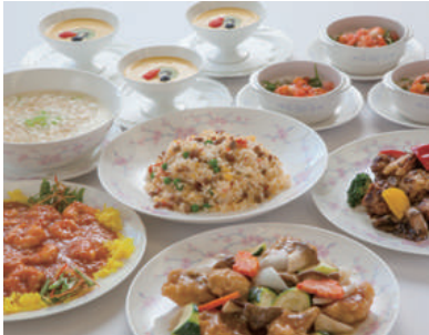
華 〜はなやか〜 ¥4,600 (7品)

海老とトマトのパリパリサラダ フカヒレと冬瓜の淡雪とろみスープ 鶏肉の衣揚げと彩り野菜の黒豆ソース 炒め / 海老のチリソース 揚げワントン 飾り / 白身魚と玉葱の香り炒め 紅ズワイ蟹入り五目チャーハン フルーツとタピオカ入りマンゴー デザート