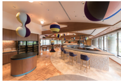
All Day Dining Karuizawa Grill