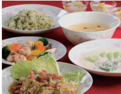
健 〜すこやか〜 ¥3,100 (6品)

蒸し鶏とくらげの棒々鶏サラダ仕立て 海老のチリソース 揚げワントン飾り 豚ロースと彩り野菜のカキソース炒め 海老蒸し餃子 ポン酢風味 紅ズワイ蟹入り五目チャーハン なめこ入り玉子スープ フルーツ入り杏仁豆腐