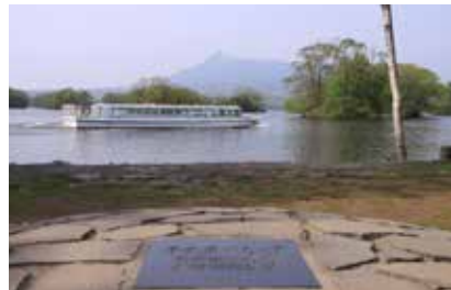
▶名曲「千の風になって」発祥の地モニュメント