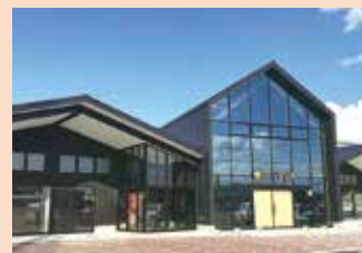
道の駅「なないろ・ななえ」

📍 亀田郡七飯町字峠下 380-2 🕒 9:00A.M. ~ 6:00P.M. ☎ 0138-86-5195 🗓 12/31 ~ 1/3 (予定)