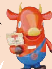
道の駅「みそぎの郷 きこない」

北海道の玄関口、北海道新幹線木古内駅 前の道の駅「みそぎの郷 きこない」では、 津軽海峡の海水から 作った「みそぎの塩」 を使った塩ソースの かったソフトクリーム が人気。ひんやりと 甘塩っぱい味をど 味ください。