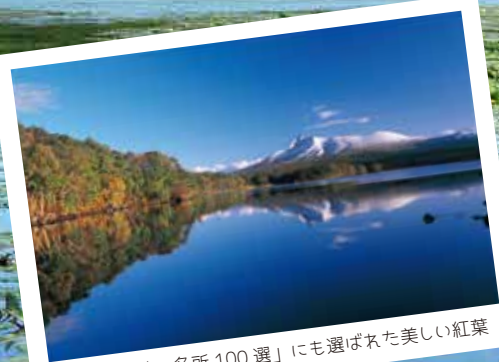
▶「日本紅葉の名所100選」にも選ばれた美しい紅葉