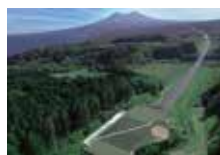
▶ 森町の鶯の木遺跡

函館市の史跡大船遺跡と史跡埴ノ島遺跡、森町の鶯の木遺跡を含む「北海道・北東北の縄文遺跡群」は、2021年7月27日、国連教育科学文化機関(ユネスコ)の世界文化遺産に登録が決定しました。約1万5千年前にさかのぼる、農耕以前の定住生活のあり方。造形美溢れる土器や独創的な土偶。貝塚や墓、環状列石などの複雑な精神文化を示す遺跡として、注目されています。