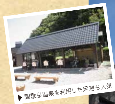
▶ 間歌泉温泉を利用した足湯も人気

鹿部町の道の駅「しかべ間歌泉公園」は、鹿部町の特産、海の幸と温泉の魅力が楽しめる複合施設。噴きあげる大迫力の間歌泉や足湯が楽しめる「間歌泉温泉公園」と鹿部の食を堪能できる「鹿部食とうまいもの館」が併設しています。