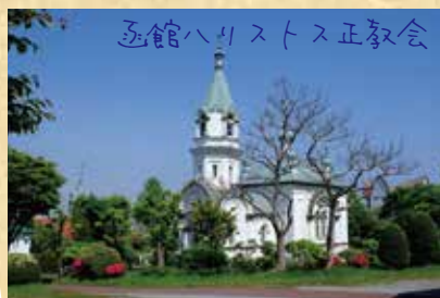
函館ハリストス正教会