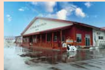
山川牧場ミルクプラント

📍 亀田郡七飯町大沼町 628 🕒 9:00A.M. ~ 5:00P.M. (11月~3月は10:00A.M. ~ 4:00P.M.まで) ☎ 0138-67-2114 🗓 4~10月は無休、 11~3月は木曜日（祝祭日の場合は翌日休）、 12月31日~3日