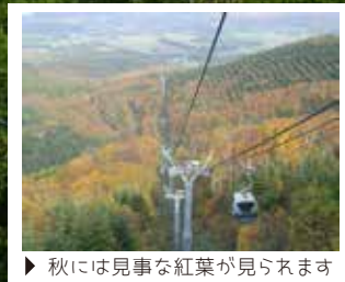
▶ 秋には見事な紅葉が見られます

3,319mのゴンドラで広大な“みなみ北海道”を一望できる函館七飯ゴンドラ。大沼国定公園や駒ヶ岳を眼前に、噴火湾（内浦湾）越しに室蘭・羊蹄山・ニセコ連峰まで広大なみなみ北海道を見渡せます。ゴンドラ山頂には遊歩道沿いに3つの展望台があり、オールシーズン様々な自然の表情を見せてくれます。